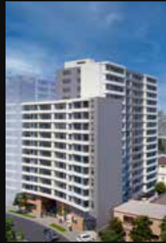
SANTA VICTORIA 99 STGO. CENTRO