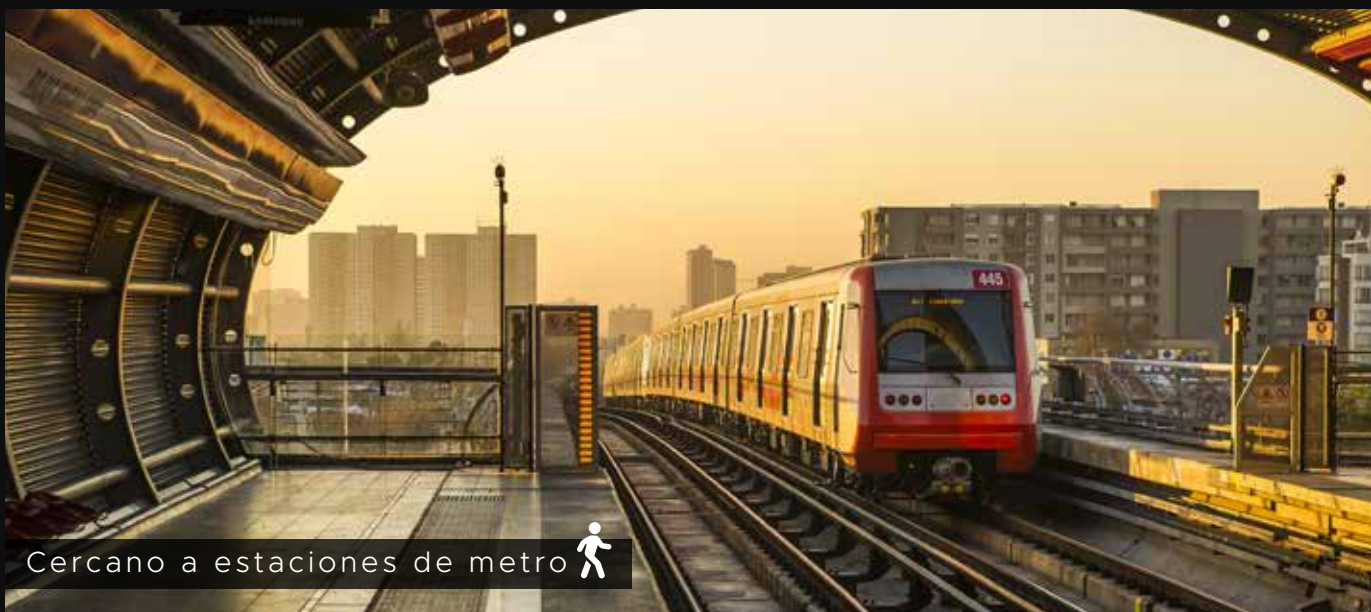
Cercano a estaciones de metro