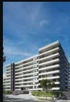
SAN VICENTE DE PAUL 5855 LA REINA