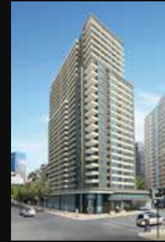
CATEDRAL 1310 STGO. CENTRO