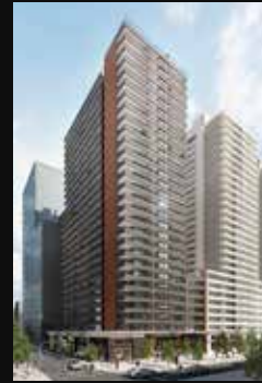
SANTO DOMINGO 1410 STGO. CENTRO