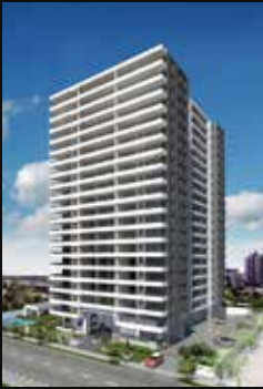
LA CONCEPCIÓN 7633 LA FLORIDA