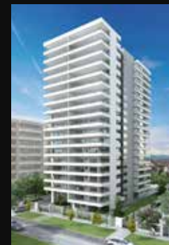
LA MARINA 1150 SAN MIGUEL