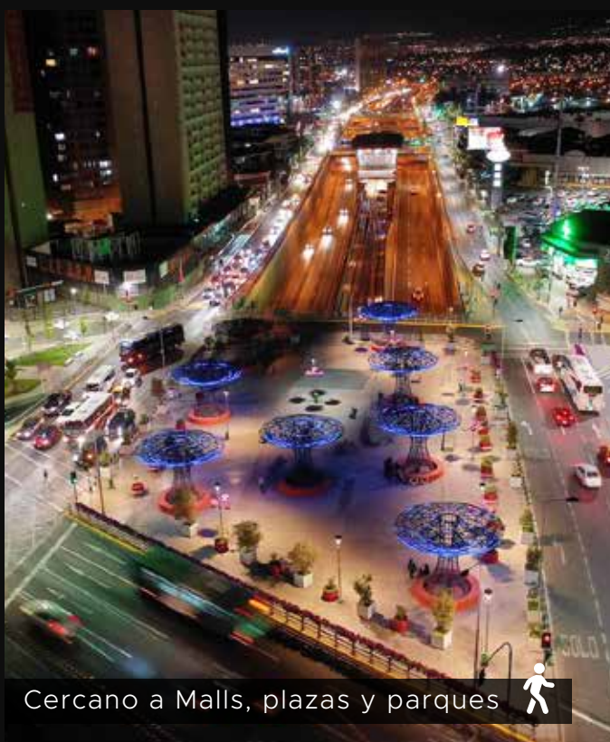
Cercano a Malls, plazas y parques